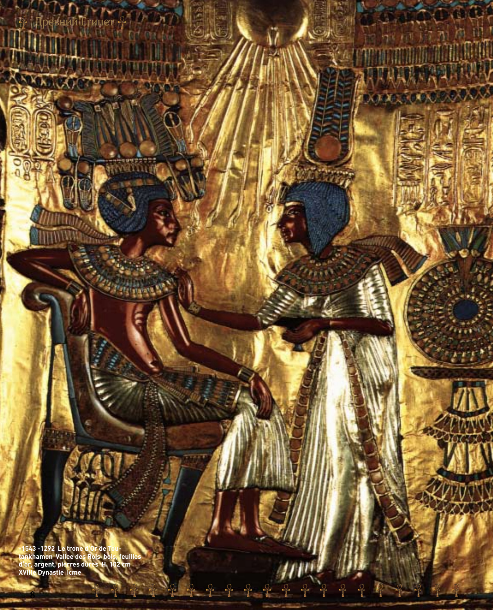
-1543 -1292 Le trone d'Or de Tou-tankhamon Vallee des Rois bois, feuilles d'or, argent, pierres dures H. 102 cm XVIIIe Dynastie Icme