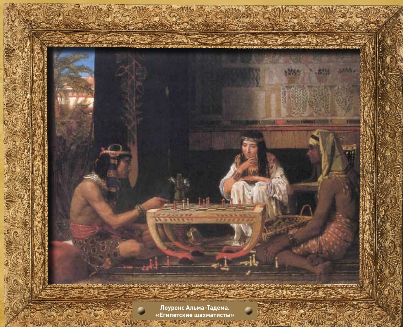
Лоуренс Альма-Тадема. «Египетские шахматисты»

который в поисках кедрового дерева для ремонта священной лодки бога Амона приехал в Финицию и столкнулся там с унижением своих чести и достоинства со стороны местных властей и вельмож. Это, конечно же, было вызвано крайним неуважением к Египту, его правителям и народу. А ведь еще каких-нибудь сто лет назад подобное невозможно было себе представить даже в кошмарном сне!