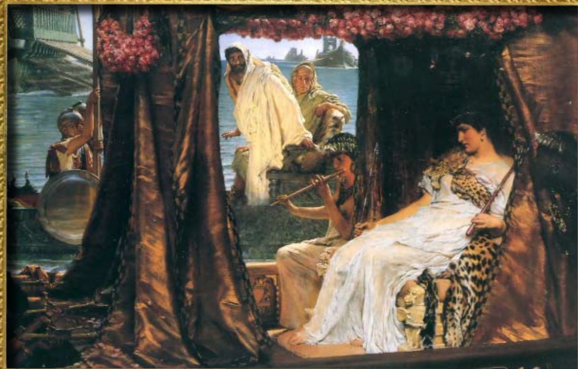
● Лоуренс Альма-Тадема. «Встреча Антония и Клерпатры» ●

столицы мира. Его ученик и преемник Марк Антоний отказался от Италии и иных провинций в пользу Октавиана Августа – лишь бы владеть Египтом и не разлучаться с этой загадочной женщиной. В конечном счете это стоило ему и власти, и жизни: он бесславно погиб в ее объятиях, хотя мог бы владеть всем.